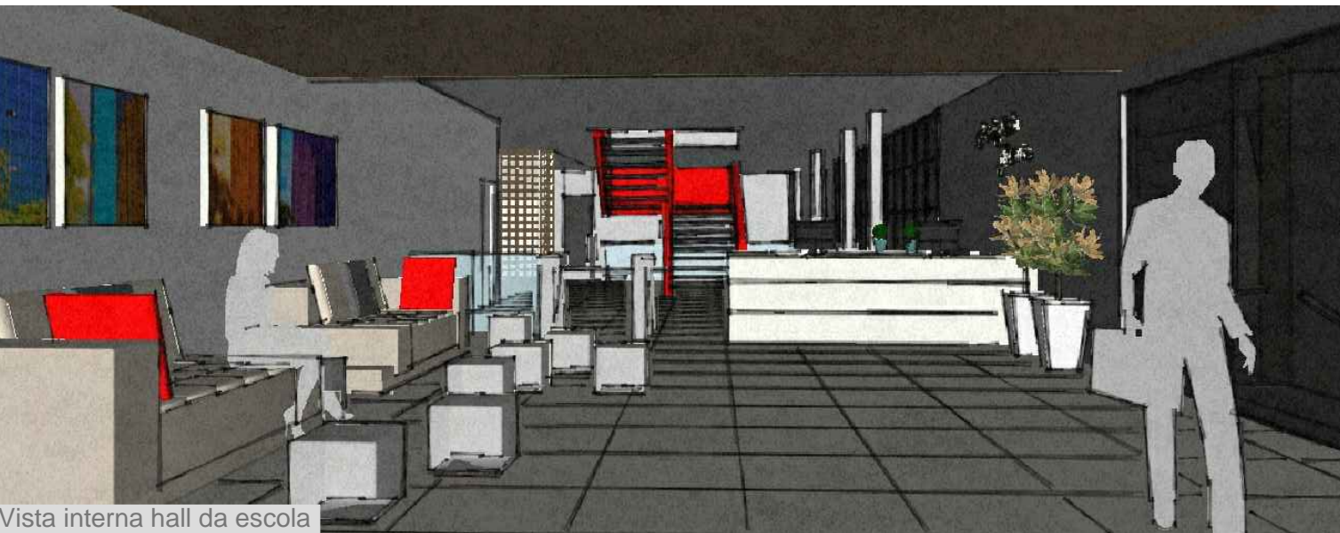
Vista interna hall da escola