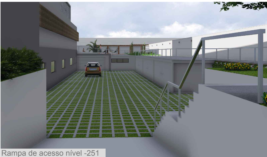
Rampa de acesso nível -251

Os acessos são marcados segundo uma hierarquia, mas com a mesma linguagem. Uma marquise marca os principais acessos à edificação. Inicia marcando o acesso da escola e se prolonga até marcar o acesso do hotel, que por baixo, recebe um pórtico de concreto vermelho, hierarquizando o hotel-escola. O restaurante é demarcado por uma marquise em formato de "C", configurando um portal de entrada, marcado por vegetação nas laterais.