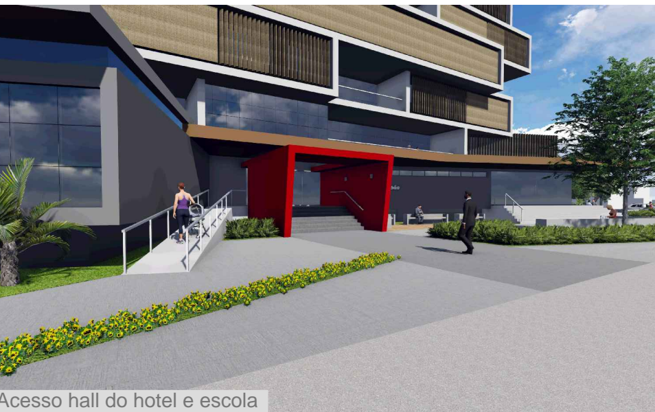
Acesso hall do hotel e escola

Os acessos são marcados segundo uma hierarquia, mas com a mesma linguagem. Uma marquise marca os principais acessos à edificação. Inicia marcando o acesso da escola e se prolonga até marcar o acesso do hotel, que por baixo, recebe um pórtico de concreto vermelho, hierarquizando o hotel-escola. O restaurante é demarcado por uma marquise em formato de "C", configurando um portal de entrada, marcado por vegetação nas laterais.