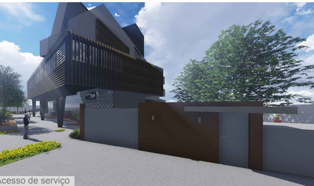
Acesso de serviço